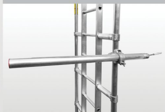
Klamra ścienna ze śrubą oczkową